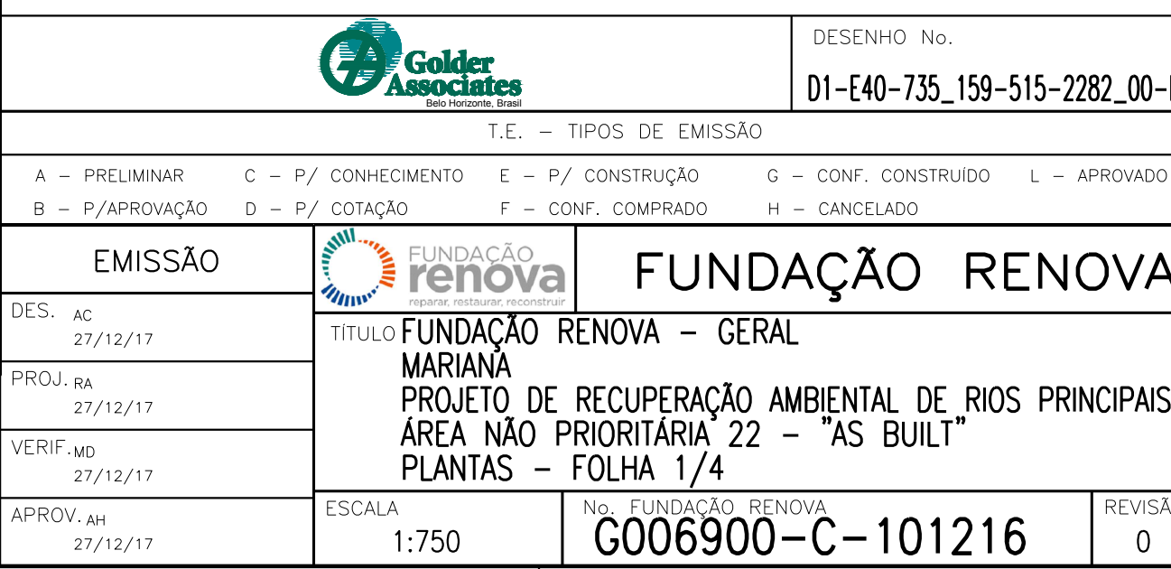
PLANTAS ESCALA 1:750